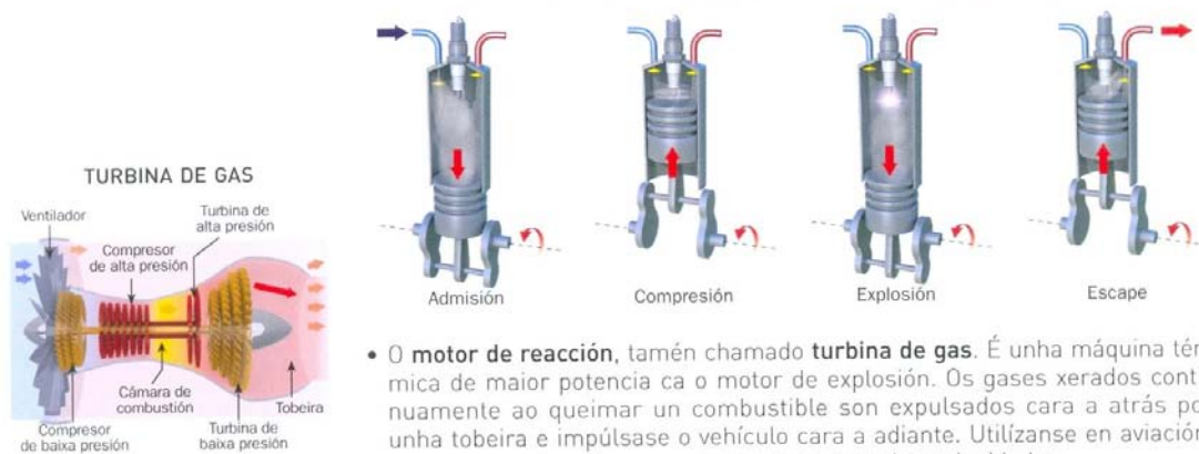
FUNCIONAMIENTO DUN MOTOR DE EXPLOSIÓN DE CATRO TEMPOS